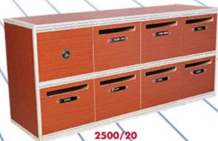
2500/20 Corps et portillons mélaminé "cajou" Profils anodisés "argent"

AUCUNE INTERVENTION SUR SITE N'EST NECESSAIRE