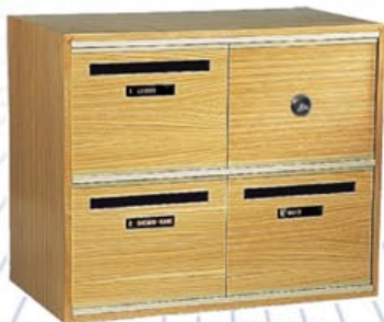
2500/60 Corps et portillons "chêne verni" Profils "champagne"